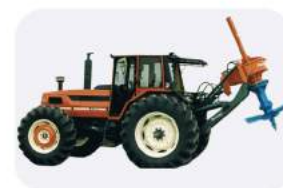
Измельчитель пней Ferri Rotor