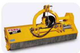
Косилка навесная MT