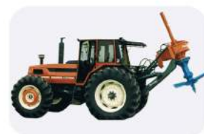
Измельчитель пней Ferri Rotor