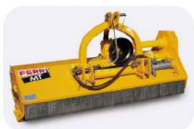
Косилка навесная MT