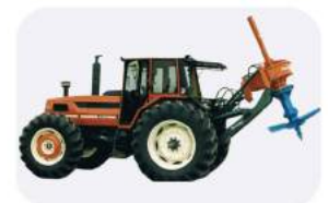
Измельчитель пней Ferri Rotor