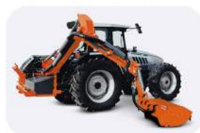
Манипуляторная косилка TXV