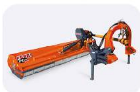
Косилка смещаемая ZHE